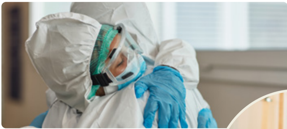
Pandemin visade på brister i välfärden. Vänsterpartiet vill bygga samhället starkt igen.

att välfärden ska bli sämre hela tiden, det beror helt på politiska beslut. Vi måste ta tillbaka kontrollen över skola, vård, omsorg och infrastruktur. Det fungerar inte att ge mindre och mindre pengar till verksamheter som dessutom ska ge en allt större andel av de pengarna till privata bolagsvinster. Det har slagit sönder välfärden och skapat otrygghet.